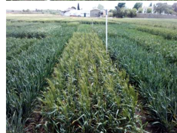
Fotografias do ensaio, abril 2019